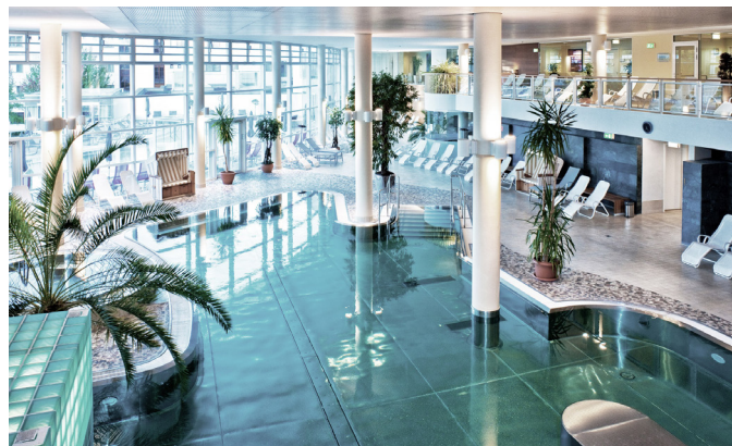
Innenpool im REDUCE Hotel Vita-Thermenbereich