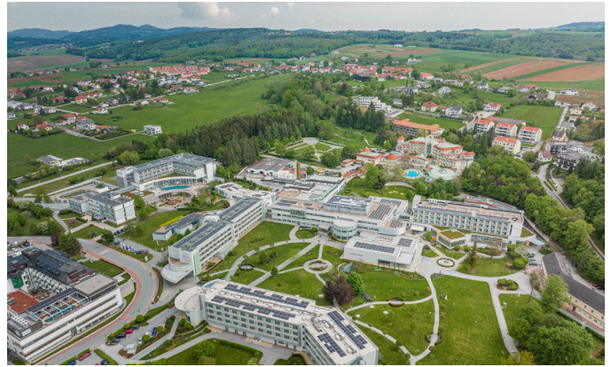
REDUCE Gesundheitsresort