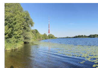
Essensimpressionen, Rigas Fernsehturm auf d. Haseninsel i.d. Düna