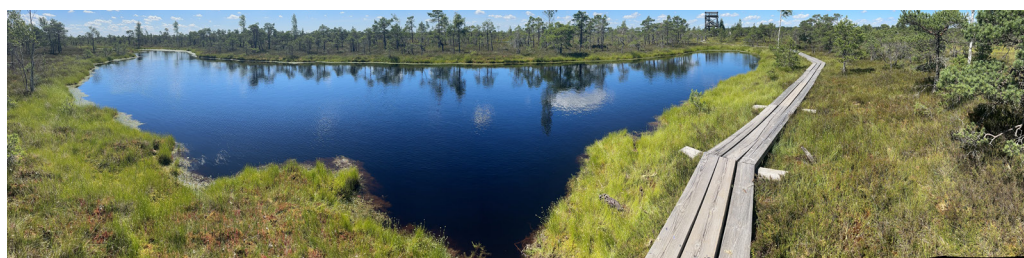
Ausflug ins wunderbar idyllische Moor im Nationalpark Ķemeri

und deutlich Geld sparen! Wenn sie im Sommer in Riga sind, gehen sie unbedingt in der Düna oder in einem der zahlreichen Badeseen schwimmen! Schwimmen in der Ostsee war bei unserem Besuch nicht zu empfehlen. Hat auch kaum ein Einheimischer getan. (Schlamm, Algen, usw.)