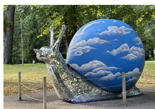
Spiegelschnecken Skulptur im Kronvalda Park, Sonnenuntergang in Riga

Wir freuen uns auf eure Erlebnisse und Tipps! mail@andisreisen.at Detaillierte Reiseinfos auf: www.andisreisen.at