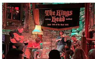
Livemusik im The Kings Head Pub - Bei der Silent Disco in Galway