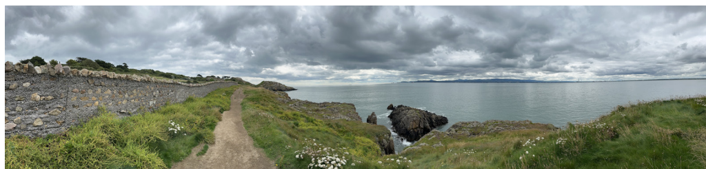
Howth Cliff Walk bei Dublin

Besuchen sie das Moor im Nationalpark Ķemeri. Essen sie unbedingt in einem der zahlreichen "LIDO" Lokale. Hier erhalten Sie günstige, authentisch zubereitete einheimische Gerichte. Lokale: lieber mit dem Bolt außerhalb des Zentrums ein gutes Lokal suchen und sehr gut essen