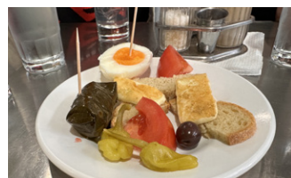
Im Milchkafee Stani