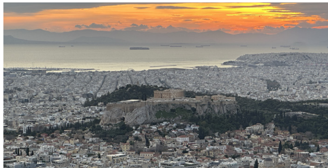
Blick vom Lykabettus (Wolfsberg) auf die Akropolis