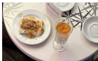
Im Lokal Ouzeri Karayiannis