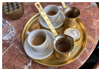
Kaffee Mokka am Markt