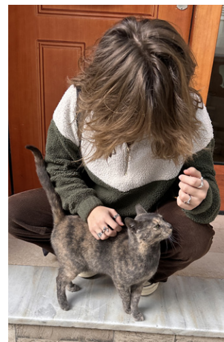
viele Katzen überall in Athen