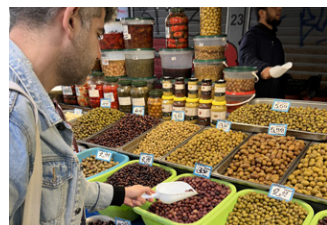
Constantine am Fruchtmarkt