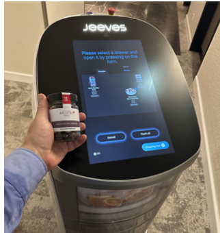
JEEVES bringt es an Türe!