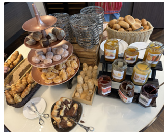
So fängt der Tag gut an im Arcotel!

www.andisreisen.at/berlin2023/Ps . Ich freue mich auf eure Berlintipps mail@donastadttecho.at