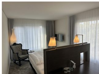
Ein freistehendes Bett- cool!