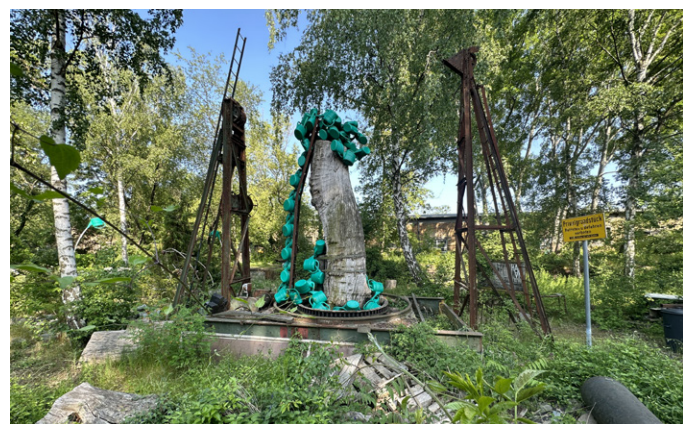
Kunstwerke von Ben Wagin beim Park am Gleisdreieck