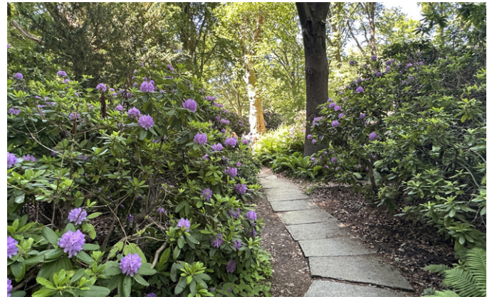
Der Rhododendronhain im Tiergarten (Park)