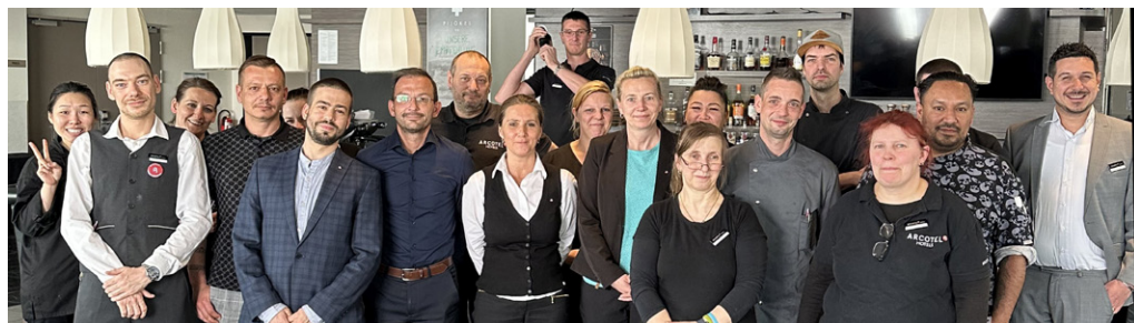
Medienkooperation mit dem ARCOTEL John F

Und genau hier findet das ARCO-TEL John F seinen Platz, um seine Internationalität zu leben. Bewusst wurde ein Name gewählt, der weltweit bekannt ist und bei den Menschen unterschiedliche Assoziationen auslöst. Lebendigkeit wird durch außergewöhn-