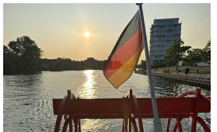
Abendliche Fahrt auf der Spree