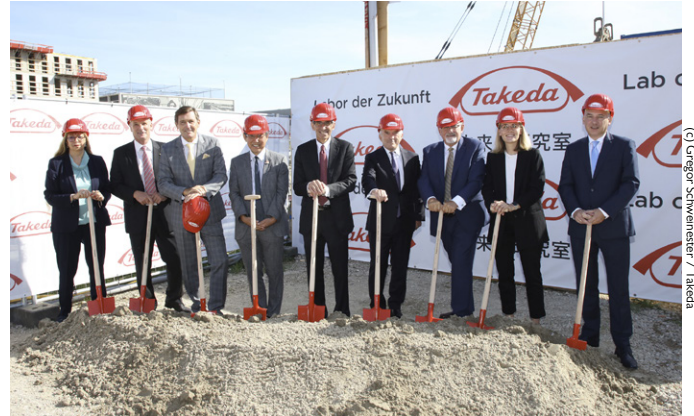
Beim symbolischen Spatenstich für ein neues Forschungs- und Entwicklungslabor in Wien Donaustadt.