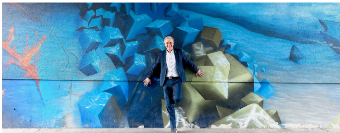
Auf das Wiener Wasser ist Verlass!

S eit 150 Jahren sorgt die Stadt Wien dafür, dass die Wiener*innen mit Trinkwasser in bester Qualität versorgt werden. Damit wir diese hohe Qualität beibehalten können und die Wasserversorgung auch in Zukunft absichern, setzt die Stadt Wien laufend Maßnahmen zur Erweiterung und Verbesserung dieser lebensnotwendigen Ressource. Eine von vielen Maßnahmen ist die Erweiterung des bestehenden Wasserwerks auf der Donauinsel. Die Abteilung MA 31 – Wiener Wasser betreibt in Floridsdorf seit 2015 ein Grundwasserwerk mit acht Filterbrunnen und einer Leistung von 500 Litern pro Sekunde. Mit