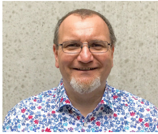
Andreas Schwantner Herausgeber